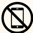
スマートフォン タブレット