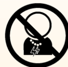
磁気仕様の アクセサリ