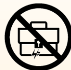
磁気仕様の 留め具