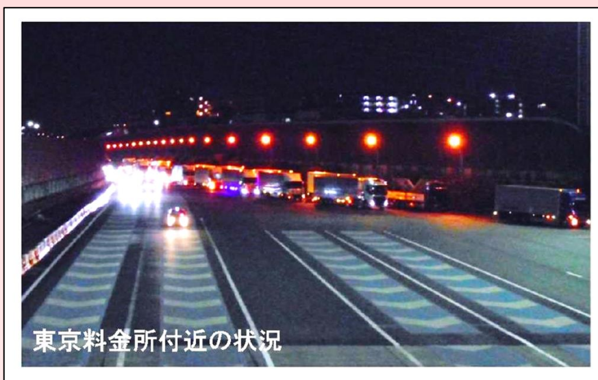
東京料金所付近の状況